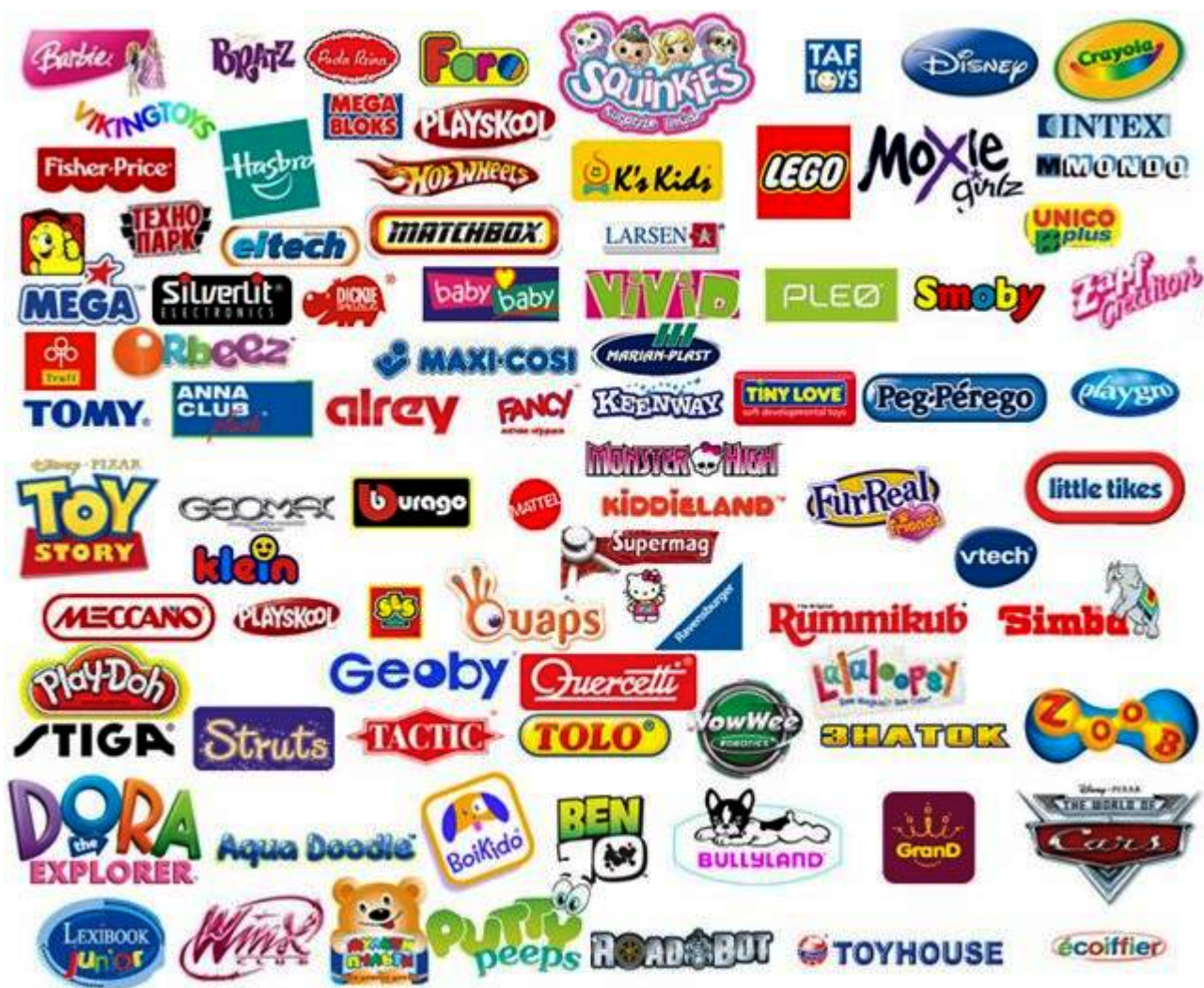
Рис. 1. Ведущие бренды детских товаров и игрушек